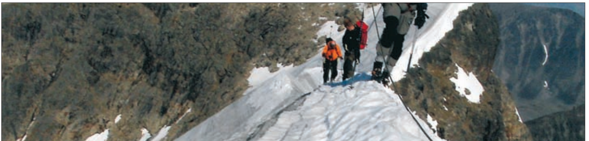
Inget utrymme för felsteg. Om du trillar ner väntar ett fall på ca 300 meter.

Så här i slutet av augusti är kanten av kammen ordentligt avsmält och är därför mycket smal de första hundra metrarna. Att det dessutom sluttar nedför