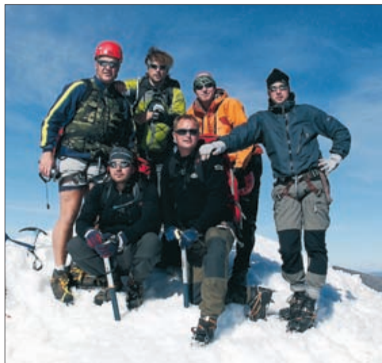
Da Nada herrklubb åter på toppen av Sveriges högsta berg.