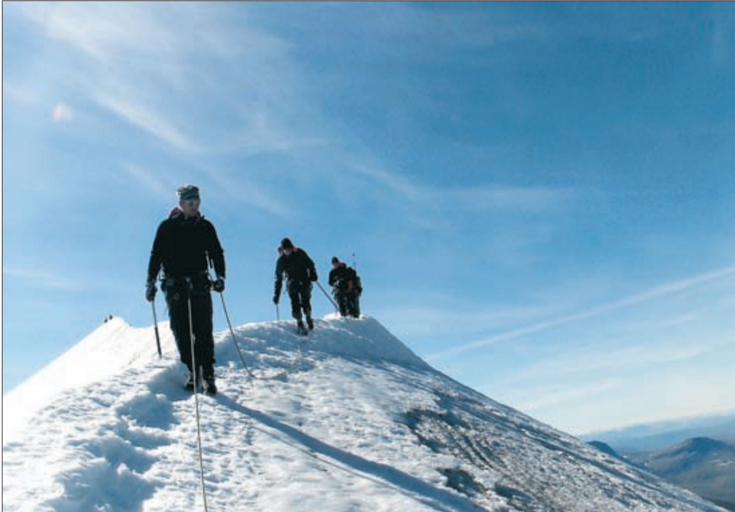
En för alla ... Sammanbundna med rep och med stegjärn på kängorna gick vi längs kanten på kammen. Långt i bakgrunden syns några bergsbestigare på sydtoppen som små prickar.