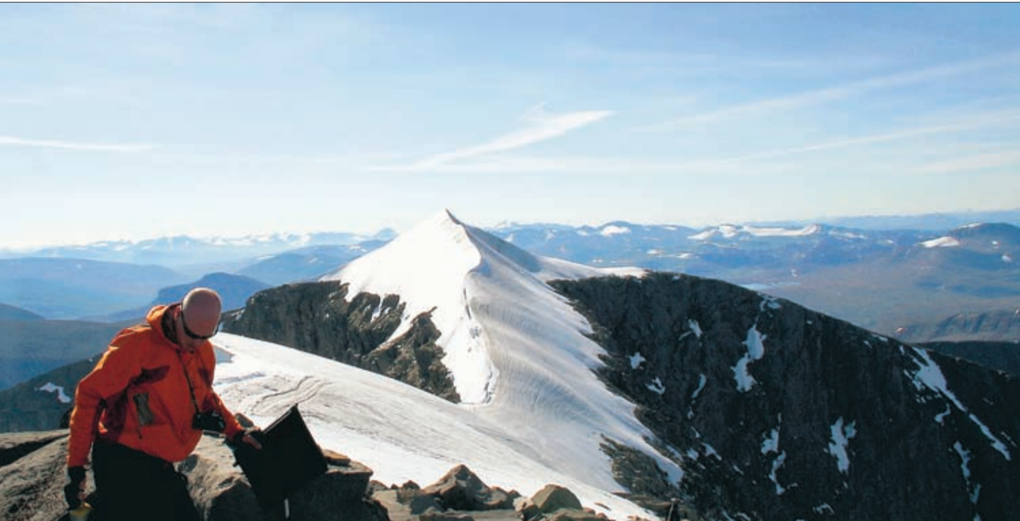
...opp, sedd från Sveriges näst högsta punkt, Kebnekaises nordtopp.