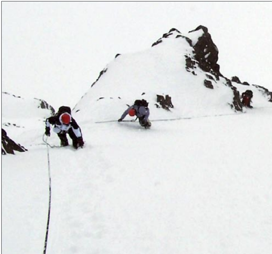
Inget bra ställe för den som är höjdrädd. Nästan 2 timmar tog klättringen uppför den mycket branta bergsväggen.