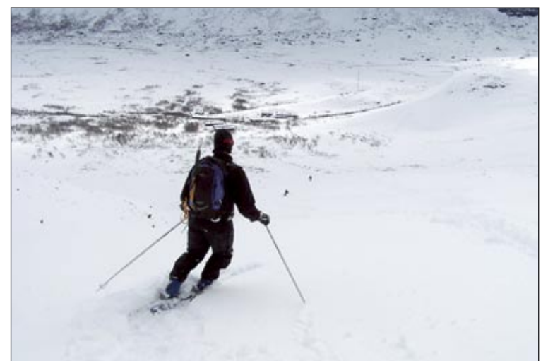
Få backar i Sverige kan skryta med större fallhöjd än om man åker ner från Kebnekaises branta sluttningar.