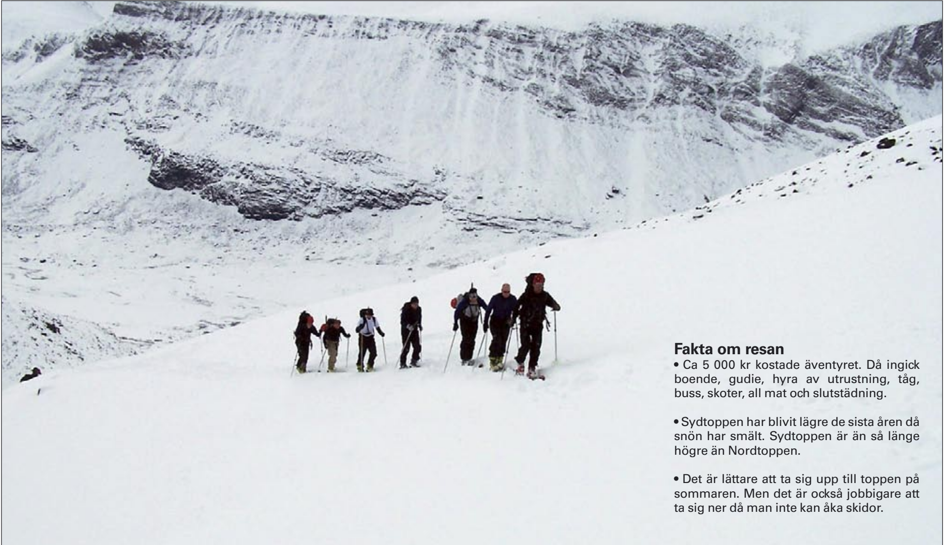
Med hjälp av stighudar kan man gå uppför mycket branta backar.