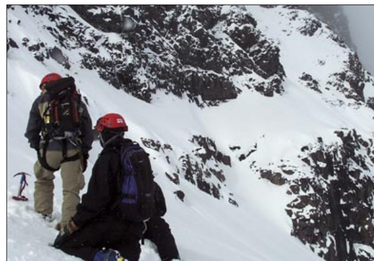
En näst intill lodrät vägg väntade den sista biten innan toppen.